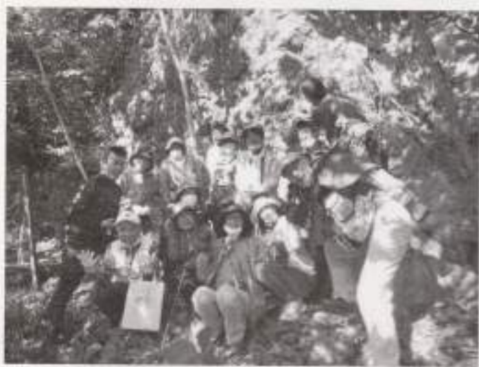
△ 田辺ジオパーク研究会の方々と大岩前で記念写真

今回の調査で見えた課題や今後の保存策について町文化財保 護審議会委員の方々や、地元地区とも協議し、大岩のより良い 保全に努めていきたいと思っています。