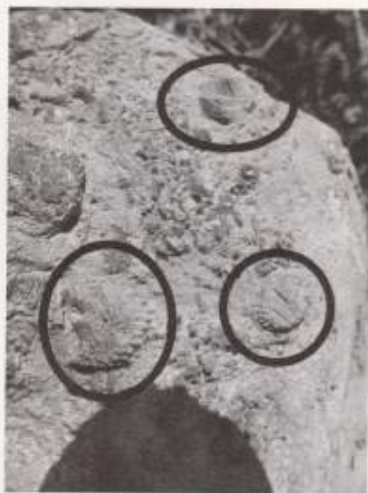
△ シダリスの化石が発見された岩の破片

楕円形の美しいものだと思像で、きました。研究会の方々を案内 する立場だった私ですが、逆にお世話になってしまいました。